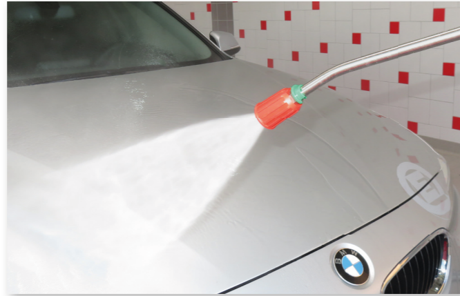
Lavage haute pression avec lance à jet plat