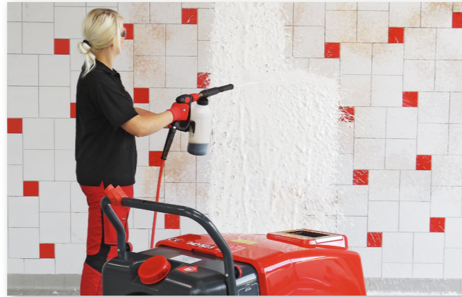
Lavage avec canon à mousse, Art-Nr. 410702