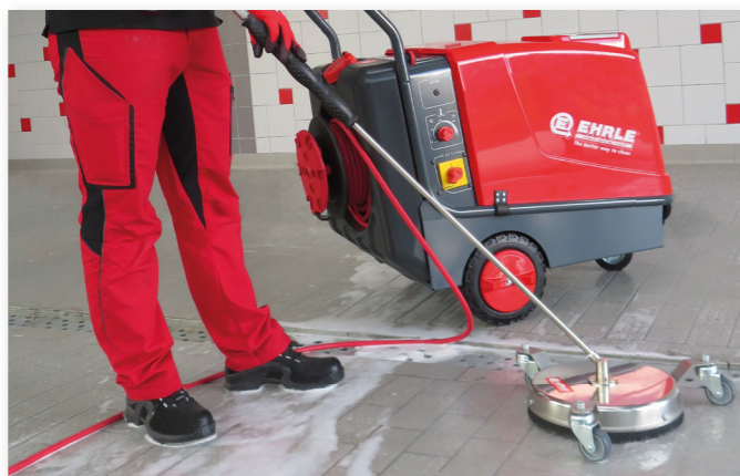
Laveur de sol inox Ø 300mm, Art-Nr. 394078