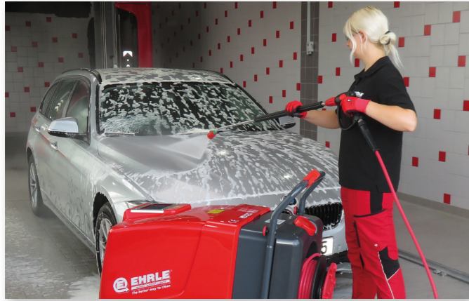
Lavage avec une lance et une buse à jet plat en acier inoxydable