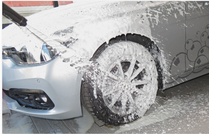
Prélavage Lavage avec canon à mousse Art-Nr. 410702