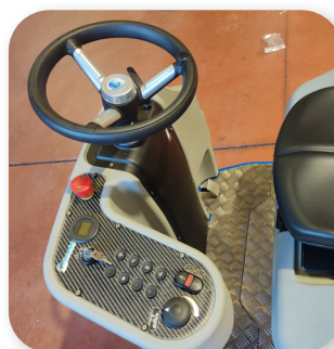
comandi semplici e intuitivi simple and intuitive controls