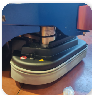
facile sostituzione delle spazzole easy brush replacement