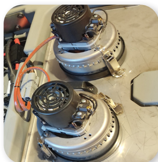
motore di aspirazione molto potente very powerful suction motor