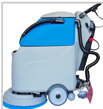
I 16 B